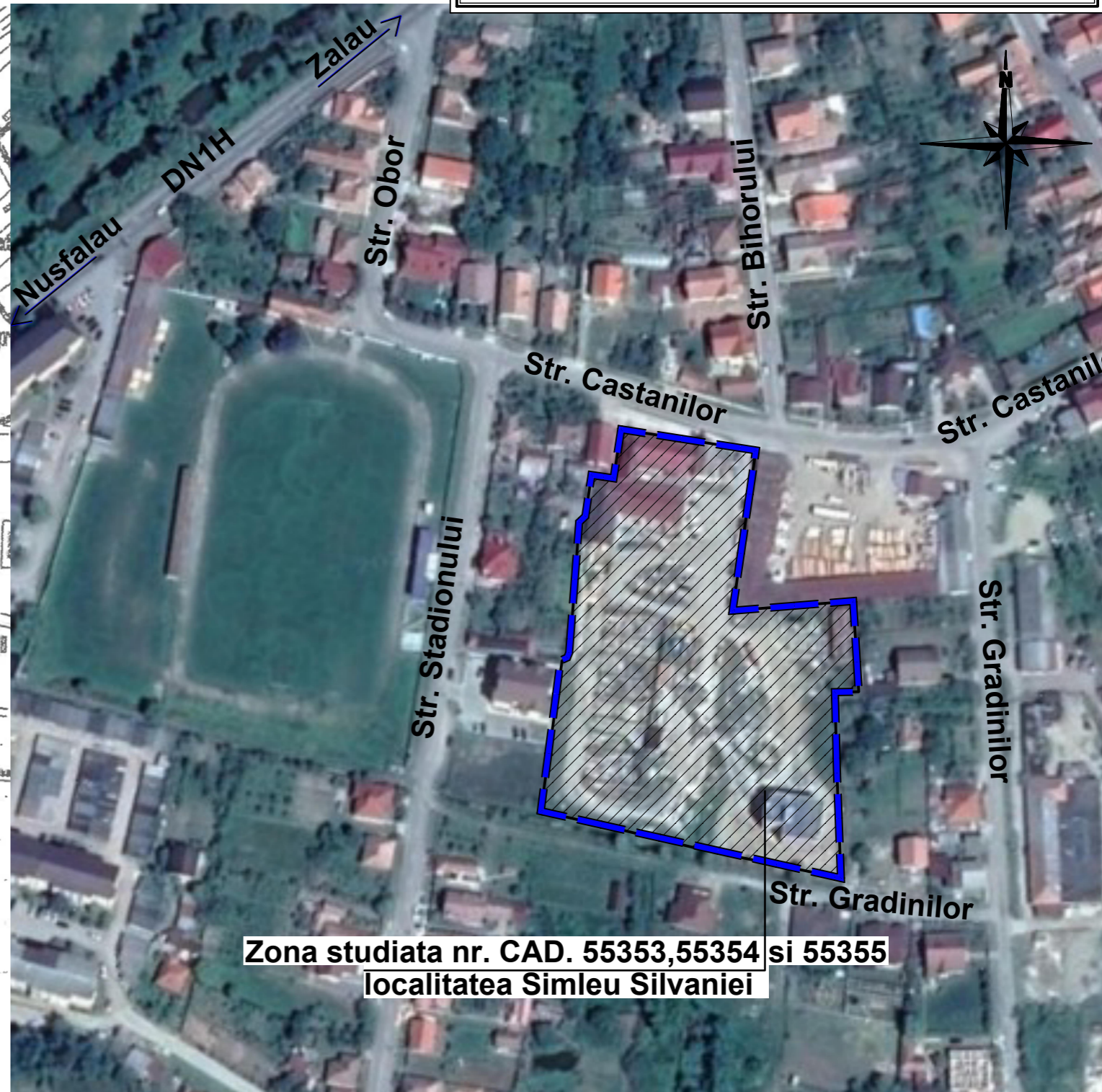
Zona studiata nr. CAD. 55353, 55354 si 55355 localitatea Simleu Silvaniei